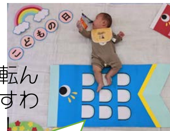
こいのぼりバージョン